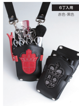
6丁入用 赤色・黒色

本体、6つのスリーブ、表カバーの8個のパーツから成り立っています。6つのスリーブはすべて取り外し可能なので、お持ちのシザー丁数に合わせて自由自在にアレンジできます。ケースの厚みはサイドのベルトで2段階に調節可能。パーツを分解できることから中の掃除もしやすく、常に清潔な状態を保てます。表側からシザーズ3丁入、3丁入、大型ポケットの3段になっていますので、コームやブラシ・ゴム手袋なども収納できます。素材は牛革(ロゴ部分は除く)で表面は光沢を抑えた