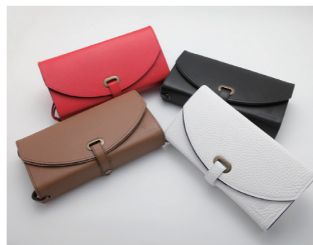
赤(内側:黒+赤)、茶(内側:うす茶+こげ茶)、黒(内側:黒)、白(内側:紺+白)

寸法/130mm×247mm×60mm、 展開寸法/247mm×432mm×25mm、重量/440g前後